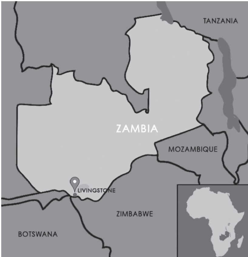
Figura 1. Mapa de Zambia que muestra la ubicación de la ciudad de Livingstone

Podría decirse que el turismo se ha convertido en una de las industrias de mayor crecimiento del siglo XXI en el mundo. En su libro Turismo y política pública , publicado en 1995, John Tribe y Colin Michael Hall reconocen y predicen el continuo crecimiento de la industria del turismo al afirmar que “el turismo es la industria más grande del mundo y se espera que continúe creciendo y manteniendo ese estado en el siglo XXI” (Tribe & Hall, 1995, p. 1). Dos décadas después de que Hall & Tribe hicieran esta predicción, el mundo ha sido testigo del crecimiento de esta industria, posiblemente a niveles sin precedentes.